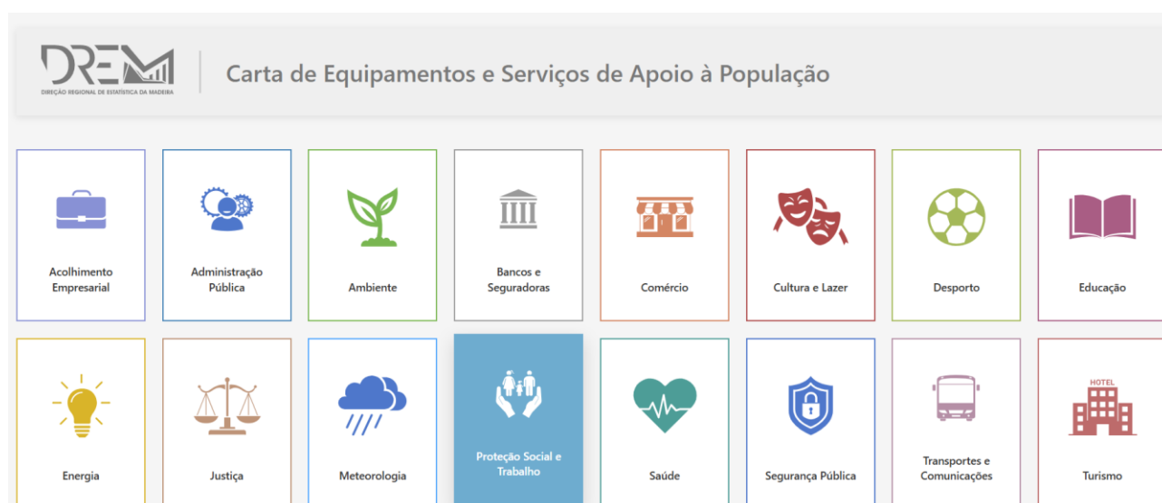
Figura 1 – Ecrã inicial da aplicação CESAP, com as 16 áreas temáticas representadas por ícones e cores distintas, que permitem o acesso direto a cada painel de análise (DREM, 2025).

A disposição uniforme e o uso de cores suaves reforçam a identidade visual da aplicação, aproximando-a dos padrões mais atuais de comunicação estatística e geográfica.